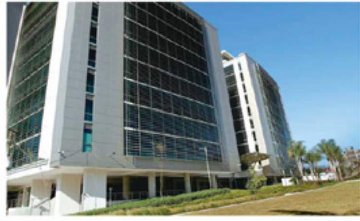
Tanto el edificio de la Cámara de Construcción que ya tiene vendidos todas sus áreas de oficinas, así como el Centro Corporativo El Tobogán y el oficentro de Asebanacio, eligieron la zona norte de San José para ubicar sus instalaciones.

Cercanía con el centro de San José es uno de los atractivos Raquel Rodríguez, Miércoles 16 Marzo, 2016